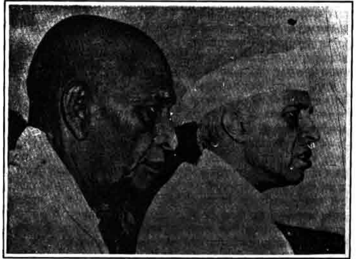
जवाहरलाल नेहरू और वल्लभाई पटेल

भी था। भारत में 562 ऐसे छोटे-बड़े राज्य थे। वे अंग्रेजों की अधीनता तो मानते थे पर जब अंग्रेज भारत छोड़ कर जाने लगे तो राजाओं ने चाहा कि वे अपना-अपना स्वतंत्र राज्य अलग चलाएँ। लेकिन इन रजवाड़ों में भी कई सालों से आम लोगों के आंदोलन चल रहे थे जो चाहते थे कि राजाओं, ज़मींदारों, जागीरदारों का शासन खत्म हो। वे भी लोगों द्वारा चुनी गई सरकार व लोगों के अधिकारों की मांग कर रहे थे। वे भारत राष्ट्र का हिस्सा बनना चाहते थे।