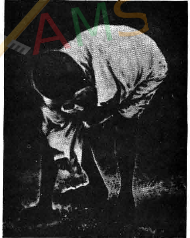
दांडी में नमक उठाते हुए गांधीजी

एक बार फिर देश भर, गांव-गांव और छोटे-बड़े शहरों में आंदोलन की लहर चली। रायपुर, भंडारा, सिवनी, अमरावती, बैतूल में आदिवासियों और किसानों ने जंगल से बड़ी मात्रा में लकड़ी काटी।