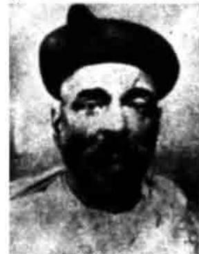
बाल गंगाधर तिलक

तिलक ने ही लोगो में जोश भरने वाला यह गरजता हुआ नारा दिया -