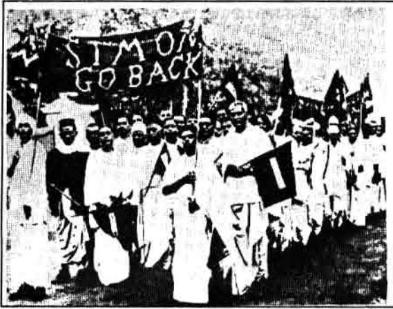
मद्रास में साइमन कमीशन के खिलाफ जुलूस

का विरोध करने के लिए लोगो ने गुब्बारो पर लिखा 'साइमन वापस जाओ' और ये गुब्बारे समारोह स्थल के ऊपर उड़ाए।