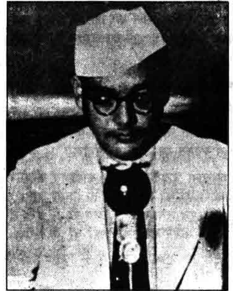
सुभाष चंद्र बोस

1939 में दूसरा विश्व युद्ध शुरू हुआ। इंग्लैंड, फ्रांस और अमरीका मिलकर जर्मनी, जापान व इटली से लड़ रहे थे। इस युद्ध के लिए इंग्लैंड भारत के लोगों और धन का उपयोग करना चाहता था। इस मौके पर कांग्रेस ने आवाज़ उठाई कि युद्ध में भारत के सहयोग के बदले में उसे स्वराज्य मिलना चाहिए। पर अंग्रेज़ सरकार इस मांग को मानने को तैयार नहीं थी। जब स्थिति यहां तक पहुंची तो 1942 में गांधीजी ने "अंग्रेजों भारत छोड़ो" आंदोलन शुरू किया। गांधी, नेहरू व अन्य नेताओं को तुरंत गिरफ्तार कर लिया गया। इससे लोग और भी भड़क गए। बड़ी संख्या में अंग्रेज़ सरकार के दफ्तर, कोर्ट-कचहरी, डाक घर, पुलिस थाने जलाए गए। शोलापुर, मद्रास और कलकत्ता में मज़दूरों ने विरोध ज़ाहिर करते हुए हड़ताल की और पुलिस से मुठभेड़ की। हज़ारों लोगों ने गिरफ्तारी दी।