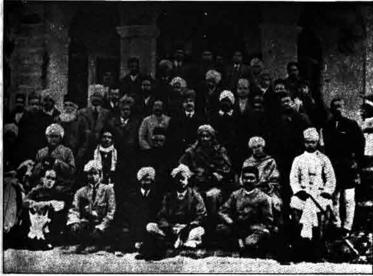
सन् 1919 में अमृतसर में हुए कांग्रेस अधिवेशन के प्रतिनिधिमंडल

कांग्रेस के अधिवेशन में देश के हर वर्ग के लोगो की समस्याओं पर चर्चा होती थी। सरकारी नीतियों की आलोचना भी होती थी। सरकार को कैसी नीतियां अपनानी चाहिए - इसके बारे में प्रस्ताव पास किए जाते थे।